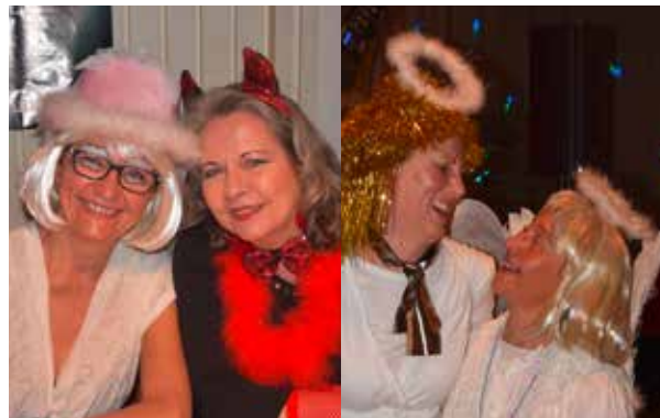
„Helden, Hexen und Heilige“ – hatten gemeinsam jede Menge Spaß beim diesjährigen Weiberfasching