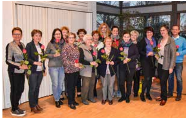
ZV-Vorstand und Gruppenleiterinnen bei der Mitgliederversammlung