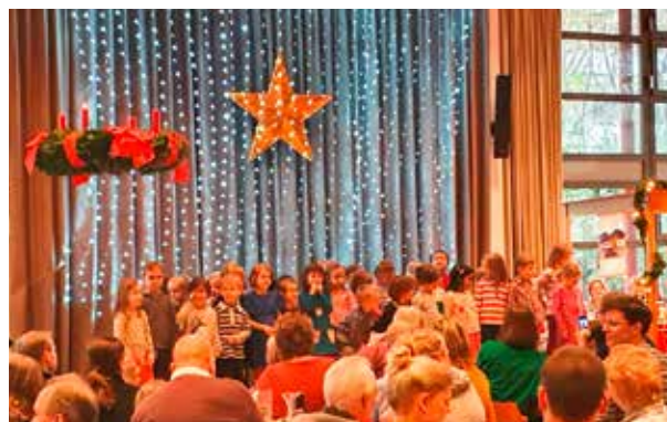
Kinder singen beim Adventsmarkt.