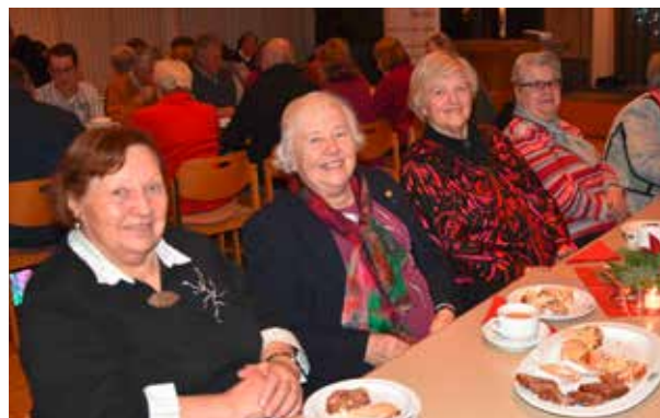
Besinnliche Adventsfeier. Dank an die HelferInnen!